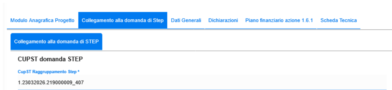
Figura 2: CUPST Raggruppamento Step

3) l'utente procede a compilare la domanda sulla procedura PROC00159 relativa all'azione 1.6.4 (salva la domanda senza chiudere la compilazione) riportando nell'apposita sezione il CUPST di Step (Figura 2)