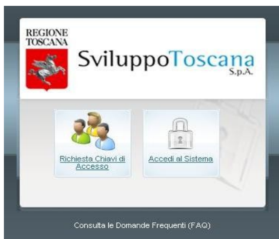
*Screenshot del modulo di accesso

Premendo il bottone sinistro si accede alla scheda di richiesta delle chiavi di accesso, con quello di destra, una volta ricevuti il nome Utente e la Password, si può accedere al sistema.