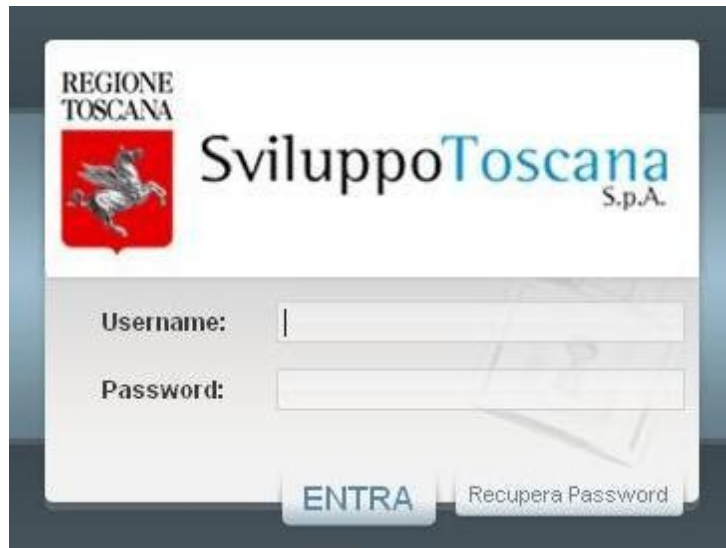
*Screenshot del modulo di login

Il Sistema Informatico è in grado di individuare il primo accesso da parte di un nuovo Utente e guidarlo per alcuni passi obbligatori tra cui: