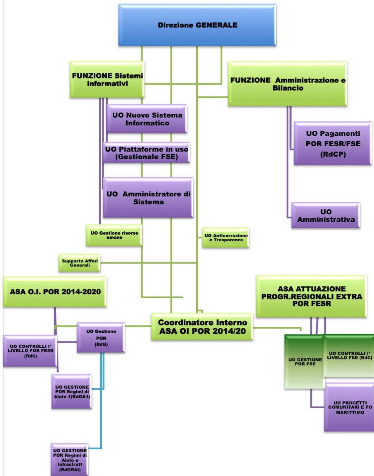
Figura 1: Organigramma ST